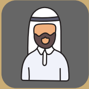
الاستاذ/ مشاري مشعل العتيبي مستشار تنمية موارد مالية عضوا